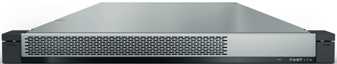
Abbildung: Silent Cube DS

Der Silent Cube DS im 19-Zoll-Format ist die neue Generation unseres WORM-Speichers zur revisionssicheren und DSGVO-konformen Archivierung. Basierend auf unserer leistungsfähigen DS-Plattform ist er mit Nettokapazitäten von 4 bis 64 TB je Einheit für jahrzehntelange sichere Archivierung geeignet - auch als Modernisierung für bestehende Silent Cubes Systeme.